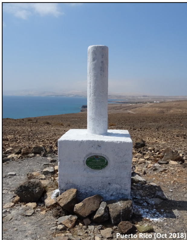
Puerto Rico (Oct 2018)