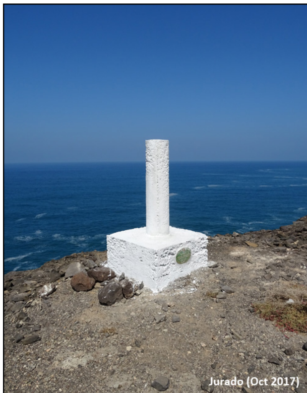
Jurado (Oct 2017)

Desde Pájara se toma la carretera a Ajuy y La Pared, a 1 Km. se separan, se sigue a la derecha hacia Ajuy y 6,3 Km. después de esta bifurcación, se entra a la derecha por un camino sólo apto para vehículo T.T., se atraviesa el barranco de Ajuy y a los 400 m. se desemboca en otro camino; se continúa a la izquierda y a los 2,5 Km. se deja un ramal a la derecha, a los 2,8 Km. se atraviesa el barranco de La Peña y a los 3,8 Km. se deja el camino, torciendo a la izquierda, campo a través hacia el mar unos 800 m., hasta llegar a la señal.