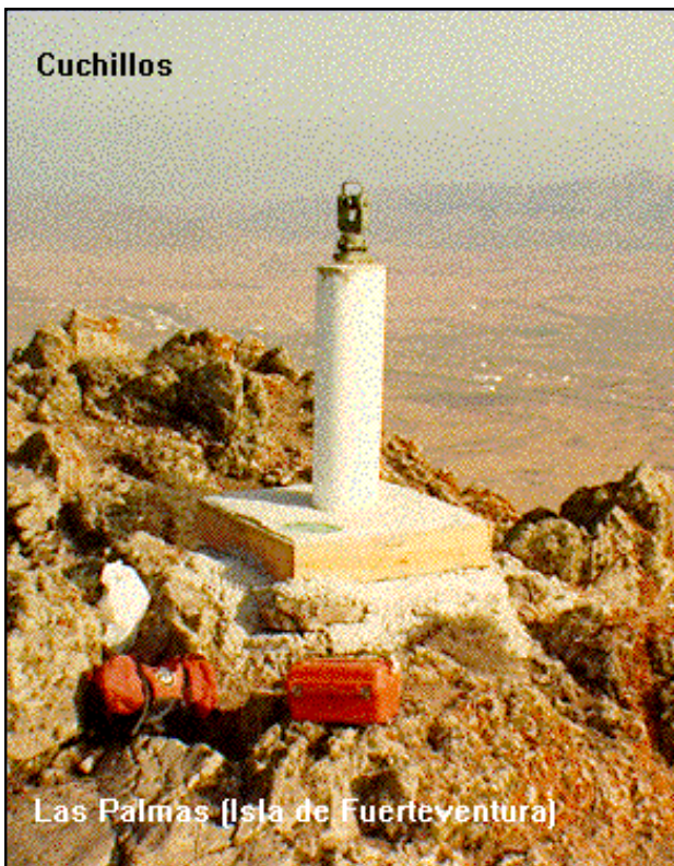
Las Palmas (Isla de Fuerteventura)