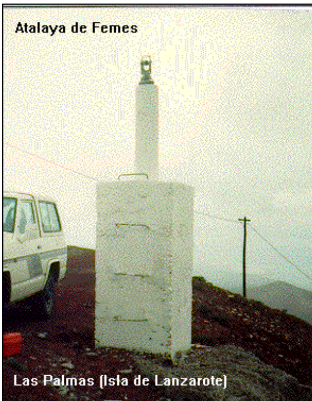
Las Palmas (Isla de Lanzarote)