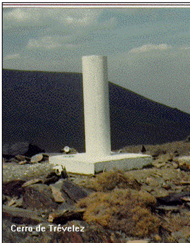
Cerro de Trévlez

Desde Jerez del Marquesado, por la pista forestal a Aldeire, que sale en dirección O., junto al molino de Antonio Gómez, a los 300 m. pasa por la ermita de San Antón, a los 1.300 m. por el campo de fútbol y deja a la derecha la pista a Cogollos de Guadix, a los 4,2 Km. le cruza el camino de Granada y a los 4,8 Km. el de Los Molinos. A los 8,3 Km. deja a la derecha el camino a la Central Eléctrica e inmediatamente se cruza por un puente el arroyo del Alhorí. Al llegar a los 9,5 Km. se deja la pista, tomando a la derecha un camino que pasa a los 12 Km. por la Casa de Ballesteros y al llegar a los 13,5 Km. y acabar el pinar, se deja el vehículo. A pie, por senda, se asciende pasando por las ruinas de la Casa de los Rojos y el puerto de Trévlez, luego a la izquierda hasta el vértice. Se tardan 2 horas.