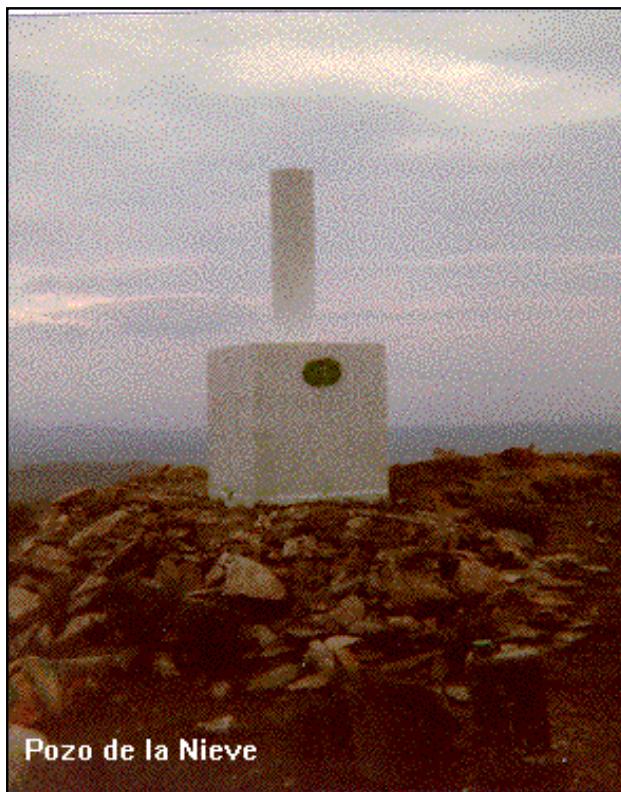
Pozo de la Nieve