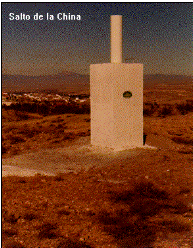
Salto de la China