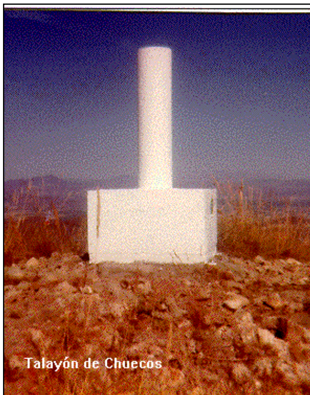
Talayón de Chuecos

Desde Águilas, por la carretera nacional N-332 de Águilas a Mazarrón, se toma como origen el punto en que sale hacia la izquierda la carretera comarcal C-3211 a Lorca. A 200 m. del origen por la nacional N-332 en dirección a Mazarrón, sale hacia la izquierda un camino que se toma. Siguiendo este camino, hay que dejar a la izquierda el camino a Tebar, a los 7.200 m. aprox., se llega al Concejo de Chuecos, donde se deja el vehículo. A pie, monte a través, se llega al vértice en 45 minutos.