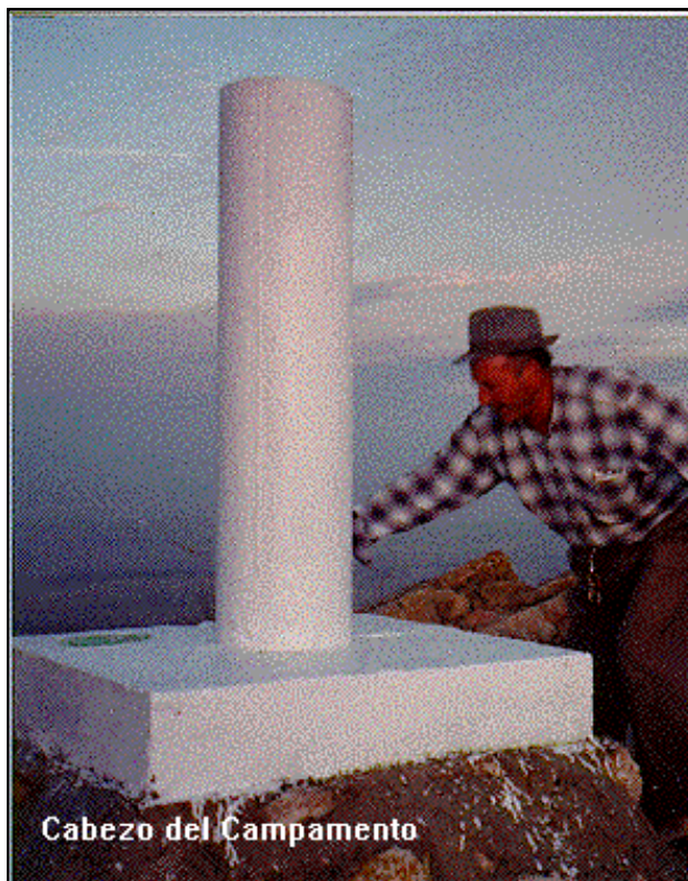
Cabezo del Campamento