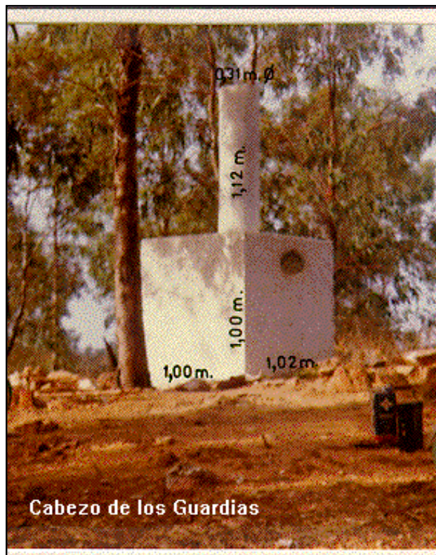
Cabezo de los Guardias