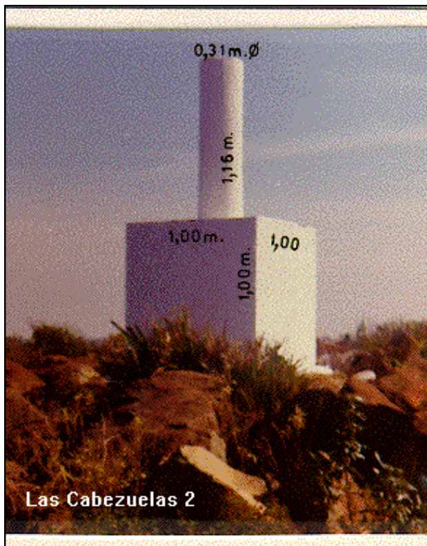
Las Cabezuelas 2