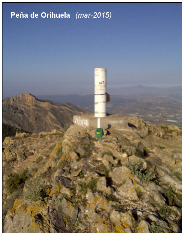
Peña de Orihuela (mar-2015)