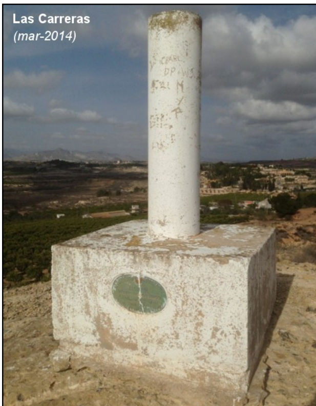
Las Carreras (mar-2014)