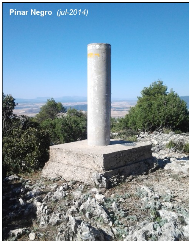
Pinar Negro (jul-2014)