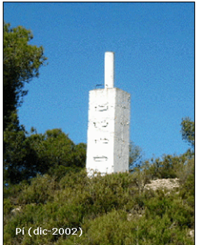
Pí ( dic-2002)