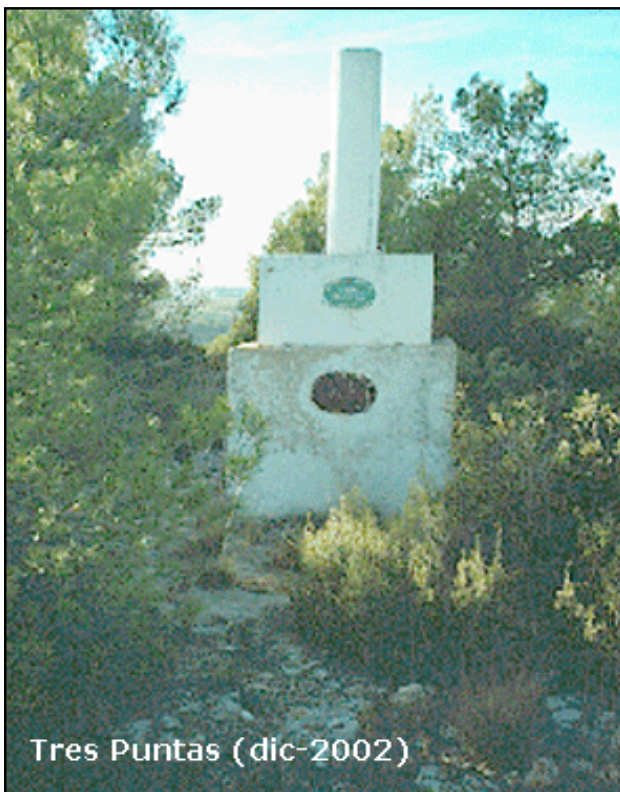
Tres Puntas (dic-2002)

Desde Almansa, por la carretera N-340 hacia Valencia, en el Km. 591,300, se entra a la derecha, a 1,2 km. se encuentra la vía de F.F.C.C. se cruza por debajo (Casas del Campillo) , 1,2 km. hasta la casa de los Sumidores, 3,5 km. más hasta la casa de la Ossa, se bordea el cerro Tres Puntas y se sube hasta el vértice, andando 20 minutos; mucho pino, cuesta verlo.