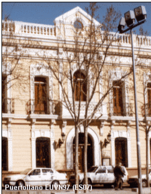
Puertollano EUVN97 (ES07)