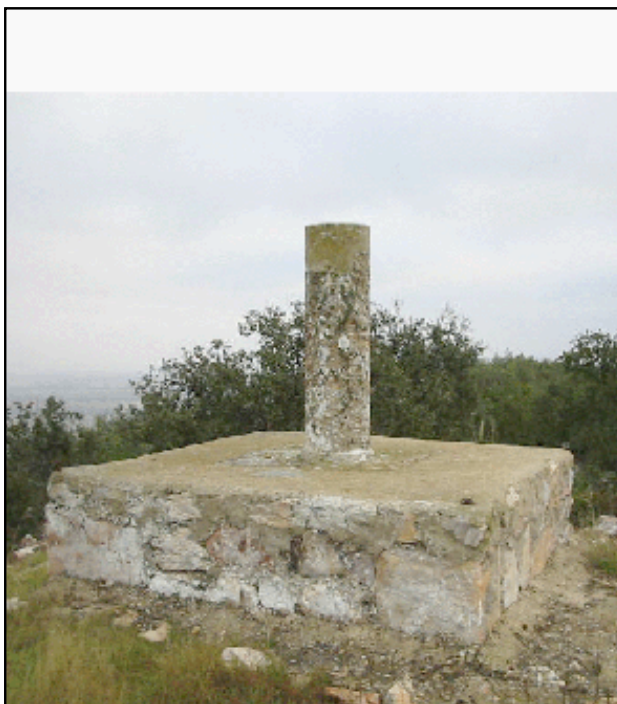
Sierra Gorda I (dic-2002)

Se accede desde Cabezarados por la carretera CM-4112 en dirección a Corral de Calatrava, en el p. K. 4,700, tomamos un camino a la derecha y a unos 100 mts de la carretera encontramos un portón con una cadena con una inscripción "Sierra Gorda" desde aquí subimos hasta una casa que está en la falda del monte, aquí dejamos el vehículo y subimos andando por un cortafuegos recientemente limpiado con paleadora y una vez en la cima recorreremos unos 150 mts a la derecha en una zona con bastante vegetación de jaras. Desde donde se deja el vehículo se tardan unos 25 minutos en llegar al vértice."