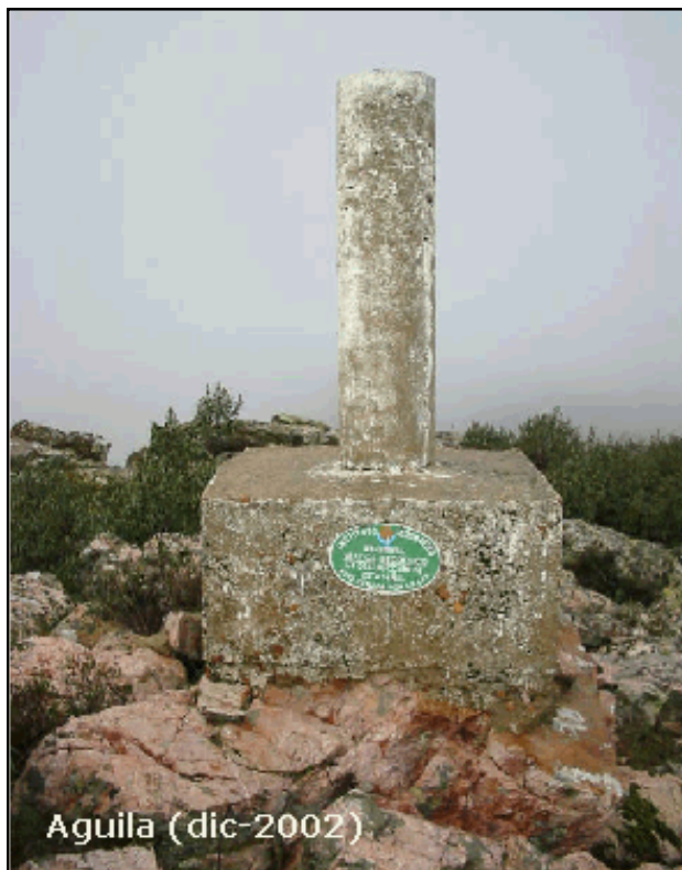
Águila ( dic-2002 )

Posible sombra de una torreta de vigilancia.