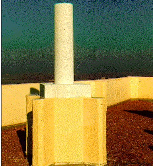
Silo Cinco Casas