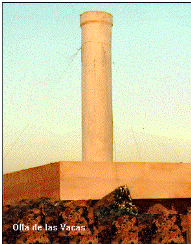
Olla de las Vacas

Desde Puebla de Don Rodrigo, por la carretera asfaltada que va a Arroba de los Montes se toma, en el P.K. 14,8 a la izquierda, la pista forestal, en buen estado, cerrada por un cable con llave (Km. 0). En el Km. 0,385 se sigue a la derecha, en el Km. 6,048 se sigue otra vez a la derecha, en el Km. 6,372, en la curva, se toma a la derecha un camino en mal estado y con mucha pendiente, solo apto para vehículo T.T., por el que se llega al collado de la Olla de las Vacas en 14 minutos. Se accede al vértice continuando desde el collado a la derecha por el cortafuegos existente, en vehículo T.T. o caminando unos 8 minutos. Nota: La llave está en la finca "Riofrío", tefno. 771004, con entrada por la carretera de Arroba de los Montes a Piedrabuena, P.K. 31,600 (puente de la Baña) a la derecha.