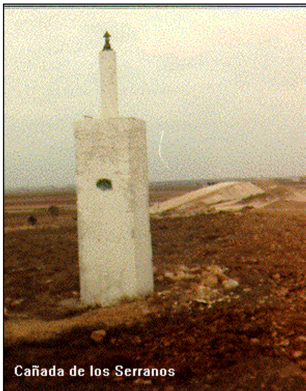
Cañada de los Serranos