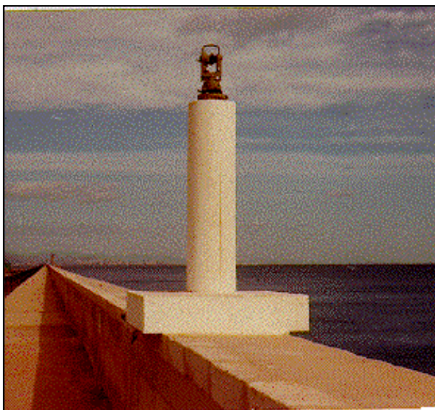
Faro de Valencia