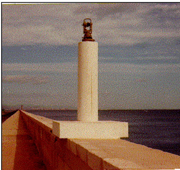
Faro de Valencia