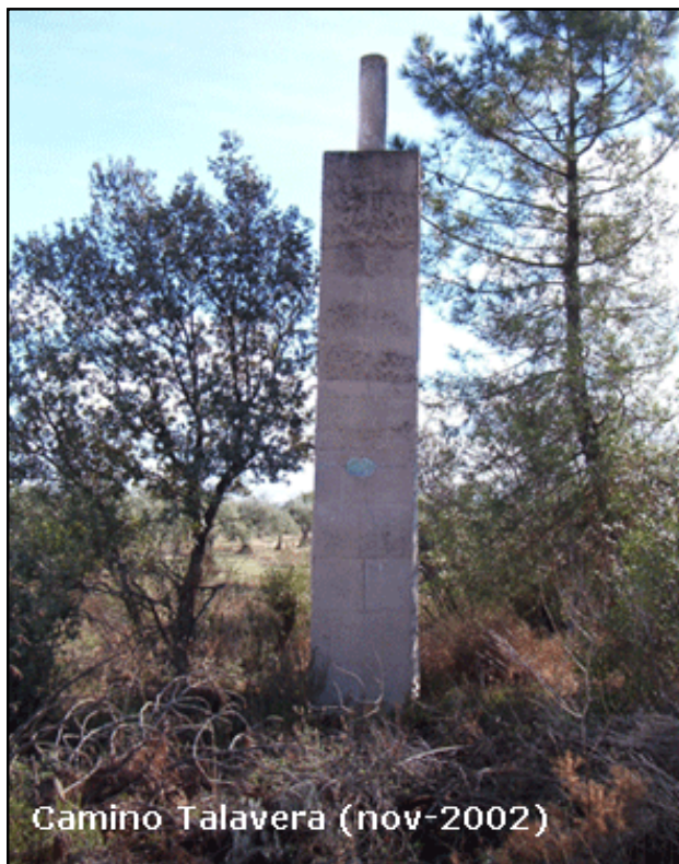
Camino Talavera (nov-2002)

Desde Castilblanco, por el antiguo camino a Talavera de la Reina, que sale del N. del pueblo, pasando junto al cementerio, cruza la carretera de Valdecaballeros a Talavera de la Reina y sigue en dirección N.; contando desde la carretera, se dejan dos caminos que la cruzan, uno a los 400 m. y el otro a los 450 m., continuando se llega a los 1.600 m. a una bifurcación, se sigue a la derecha, luego a los 4.400 m. hay otra, se toma a la izquierda y a los 5.300 m. se llega al vértice, que está en la margen derecha del camino.