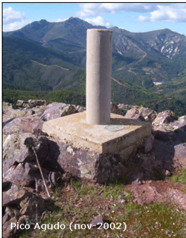
Pico Agudo (nov-2002)

Desde Guadalupe, se coge la carretera que sale por el oeste, y que va hacia la EX-102. Por el P.K. 2,1, se coge la pista que lleva a la Ermita de Santa Catalina, y ahí, cogemos el camino que lleva a la Ermita de Mirabel. A los 6.300 m. se deja un camino a la derecha y a los 7.500 m. se llega al Collado del Castaño del Abuelo, donde se deja el vehículo. Desde aquí, andando hacia la izquierda, se llega al vértice en 20 minutos. Tras la Ermita de Santa Catalina hay cancela con candado, se abre los jueves de 8 a 12 h.