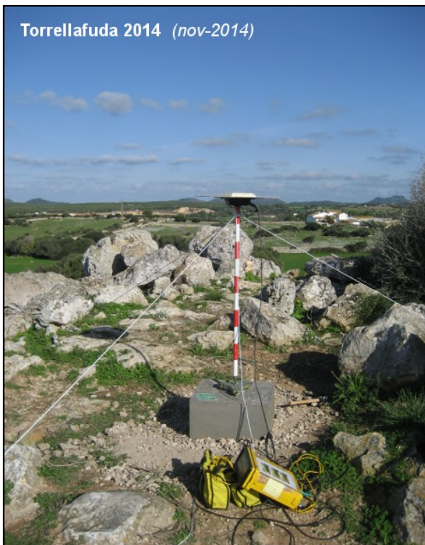
Torrellafuda 2014 (nov-2014)

Parciamente cubierto por matorral alto y arbustos.