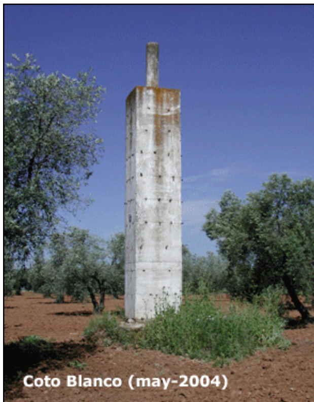
Coto Blanco (may-2004)