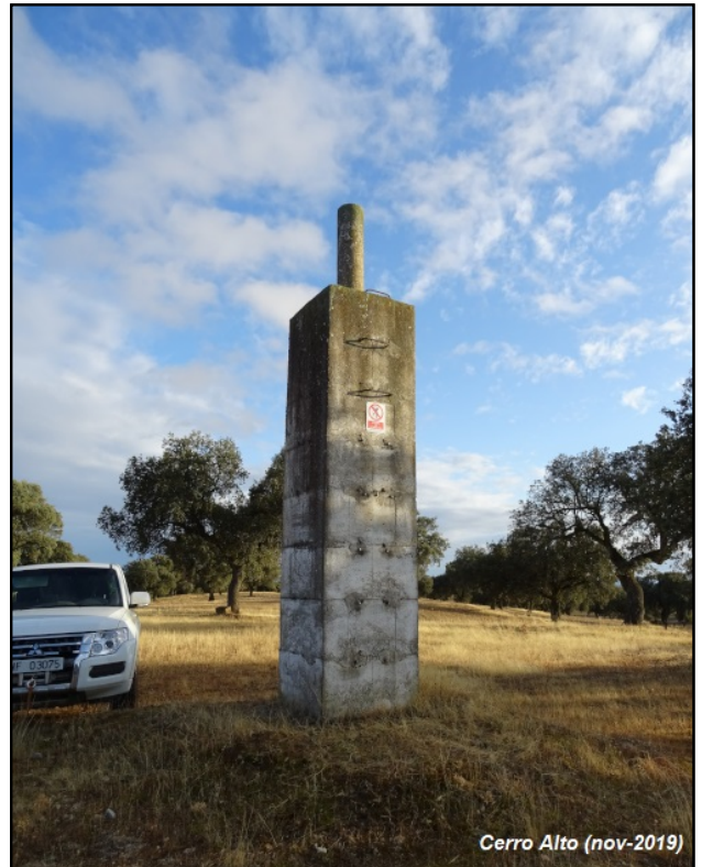
Cerro Alto (nov-2019)