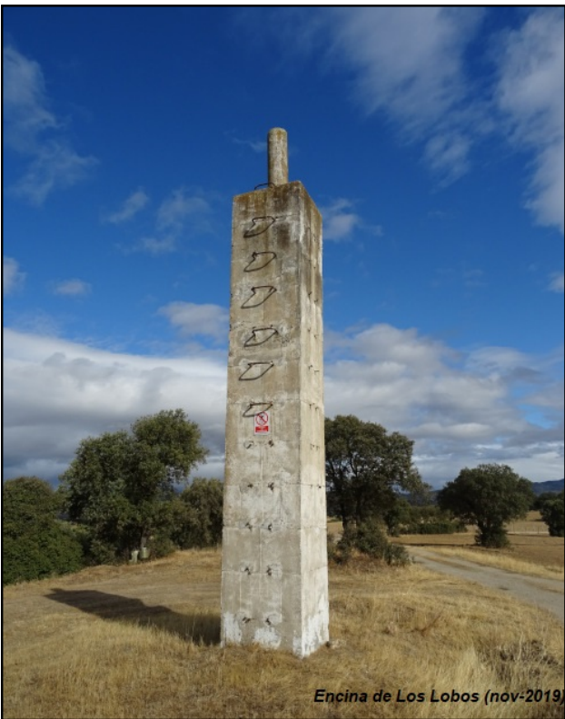
Encina de Los Lobos (nov-2019)