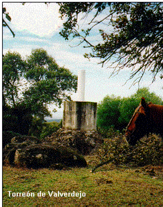
Torreón de Valverdejo