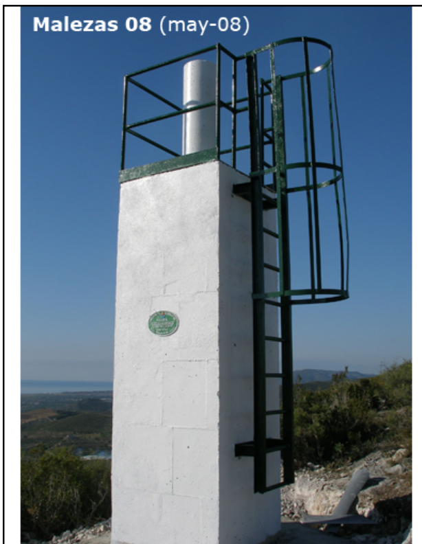
Malezas 08 (may-08)