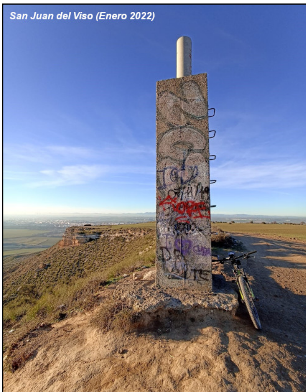
San Juan del Viso (Enero 2022)