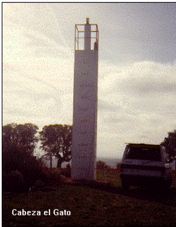
Cabeza el Gato