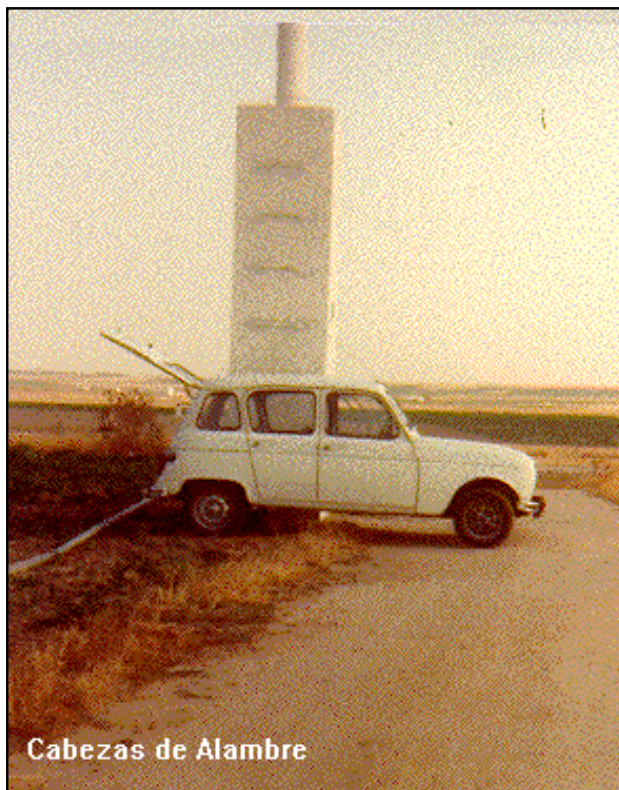
Cabezas de Alambre