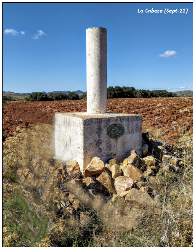
La Cabeza (Sept-21)

Desde Murero se sale por la carretera hacia Atea, nada más empalmar con la que viene de Daroca en el km. 10,105 se entra a la izda. por un camino que en su lado dcha. hay un peirón (pilar con capilla) a 700 m. se bifurca, se sigue a la izda., dejando a 1.500 m. camino a la izda., a 2.000 otro a la dcha. y a 2.450 m. uno a la izda., llegando a los 2.730 m. junto a la señal.