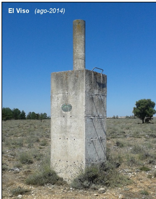
El Viso (ago-2014)