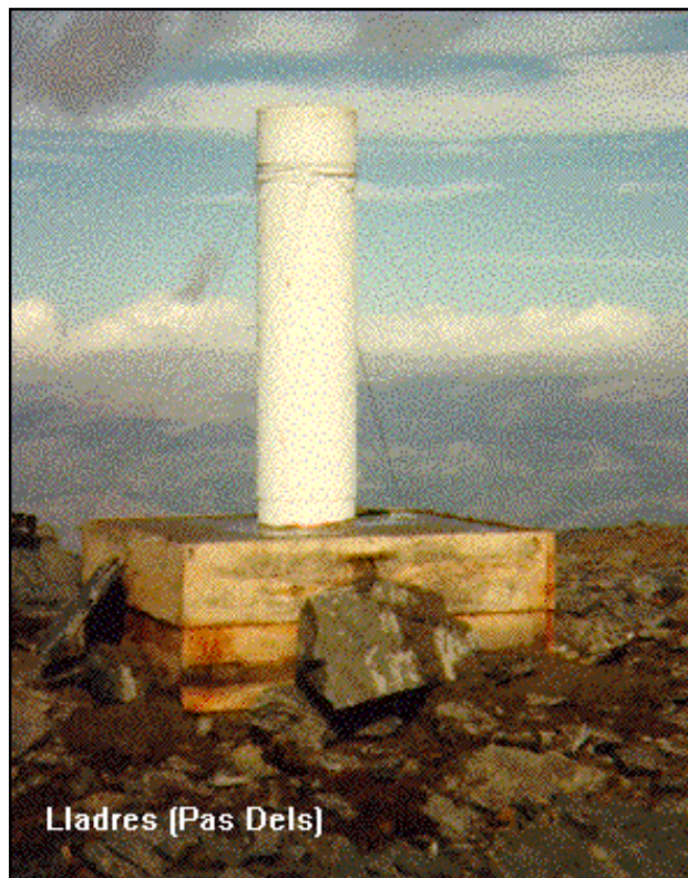
Lladres (Pas Dels)

Desde Puigcerdá, por la carretera a Bourg-Madame, y de aquí por el desvío a Osseja. Desde Osseja por la pista asfaltada con cartel indicativo "Route Forestiere". Por esta pista, después de recorrer 12,5 Km., se llega al final del asfalto, unos metros antes sale a la izquierda una pista de tierra próxima a la frontera hispano-francesa que lleva al vértice en 5 Km. Es accesible en vehículo T.T.