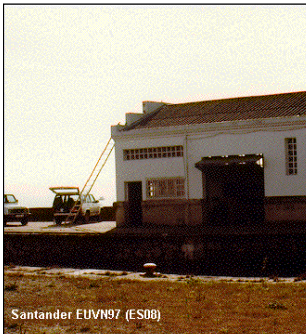
Santander EUVN97 (ES08)