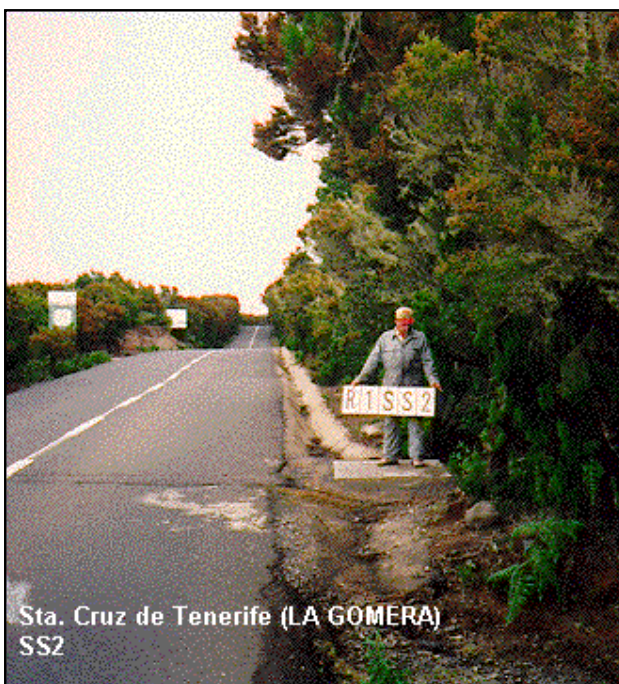
Sta. Cruz de Tenerife (LA GOMERA) SS2

Situada en la carretera de Vallehermoso a Valle Gran Rey, en la solera de un registro de Telefónica y en la margen E. de la carretera, frente al camino que conduce al Mirador de Alojera, según croquis