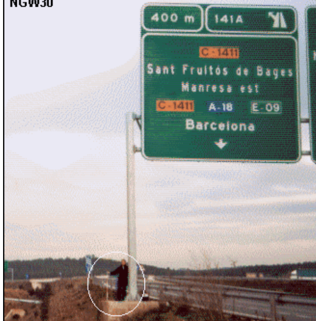
Manresa (Punto Nodal 000-038) NGW30

Clavo metálico semiesférico incrustado aproximadamente en el Km.141,4 de la margen sur del carril dirección Manresa Carretera C-25 de Cervera a Girona, sobre la esquina sudoeste de la zapata de hormigón que sustenta la pata sur de un panel de información superior y a unos 550 m. de la anterior.