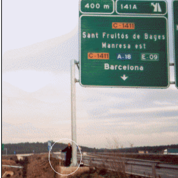
Manresa (Punto Nodal 000-038) NGW30

Clavo metálico semiesférico incrustado aproximadamente en el Km.141,4 de la margen sur del carril dirección Manresa Carretera C-25 de Cervera a Girona, sobre la esquina sudoeste de la zapata de hormigón que sustenta la pata sur de un panel de información superior y a unos 550 m. de la anterior.