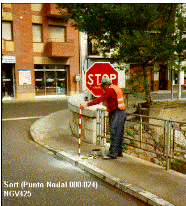
Sort (Punto Nodal 000-024) NGV425

Agrupada con: 560001 - NGV974, 561068 - NGV973, 562001 - NGV426.