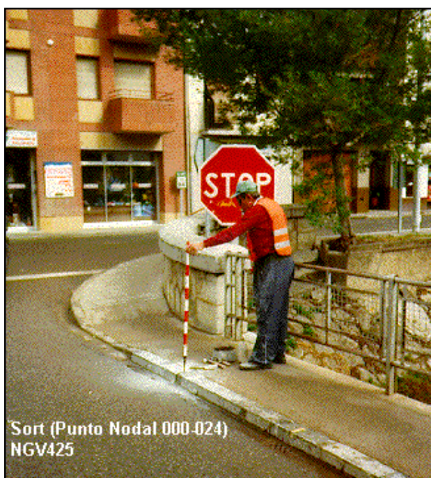
Sort (Punto Nodal 000-024) NGV425

Agrupada con: 560001 - NGV974, 561068 - NGV973, 562001 - NGV426.