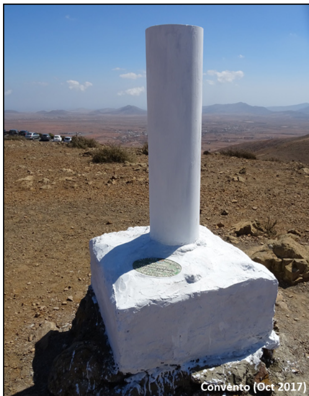
Convento (Oct 2017)