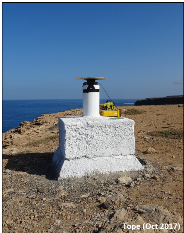
Tope (Oct 2017)