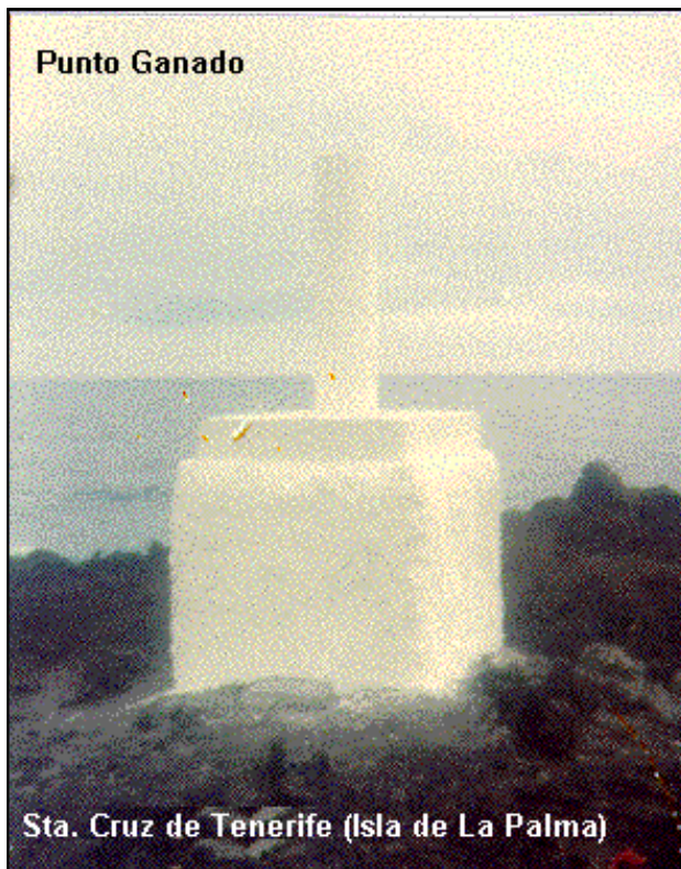
Sta. Cruz de Tenerife (Isla de La Palma)