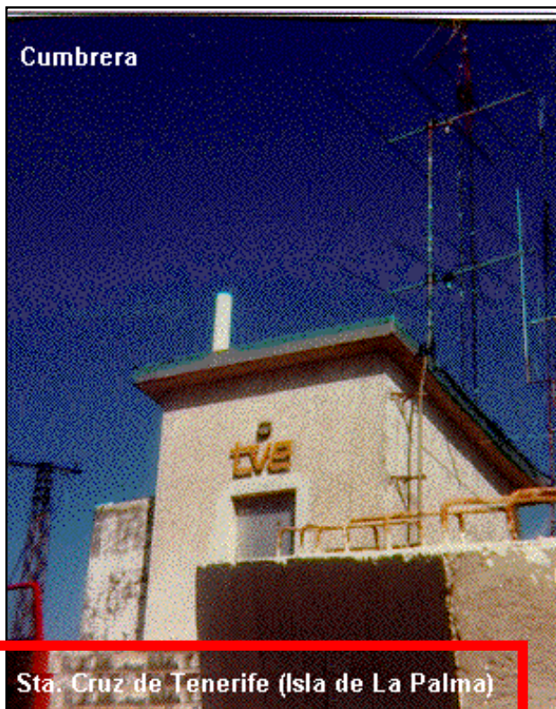
Sta. Cruz de Tenerife (Isla de La Palma)