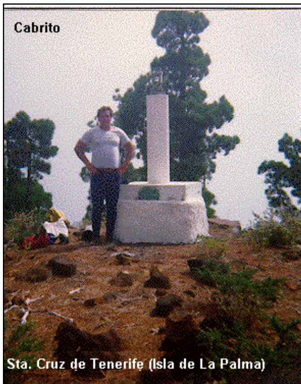
Sta. Cruz de Tenerife (Isla de La Palma)