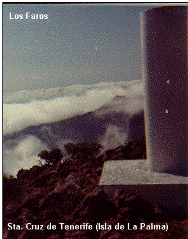
Sta. Cruz de Tenerife (Isla de La Palma)