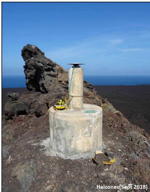
Halcones (Sept 2018)

Desde Yaiza, por la carretera a Playa Blanca, recorridos 1.500 m. se tuerce a la derecha por la pista de tierra a El Golfo. Después de 4.200 m. de pista, se toma a la derecha por un camino que a los 1.500 m. llega a las casas de Juan Perdon y a un chalet frente a éstas, donde se deja el vehículo. A pie se sigue el camino, que está cortado en varios puntos, por lo que no se puede seguir con vehículo; se recorre desde el chalet 1 Km. y se sigue a la derecha por una vereda, señalizada con pintura blanca, que va entre lavas y conduce a la falda del monte. Después, sin senda y con dificultad hasta lo alto, tardándose 1 hora en total.