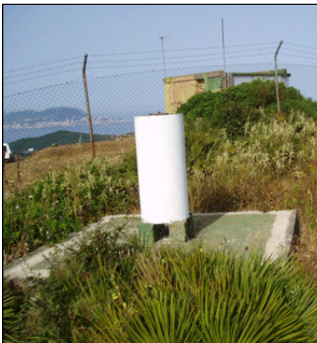
VN3 [Acebuche] (jun-2004)