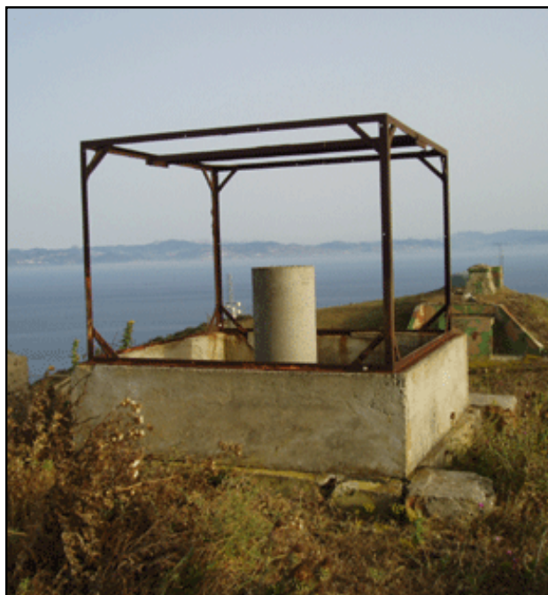
VN2 [Cascabel] (jun-2004)